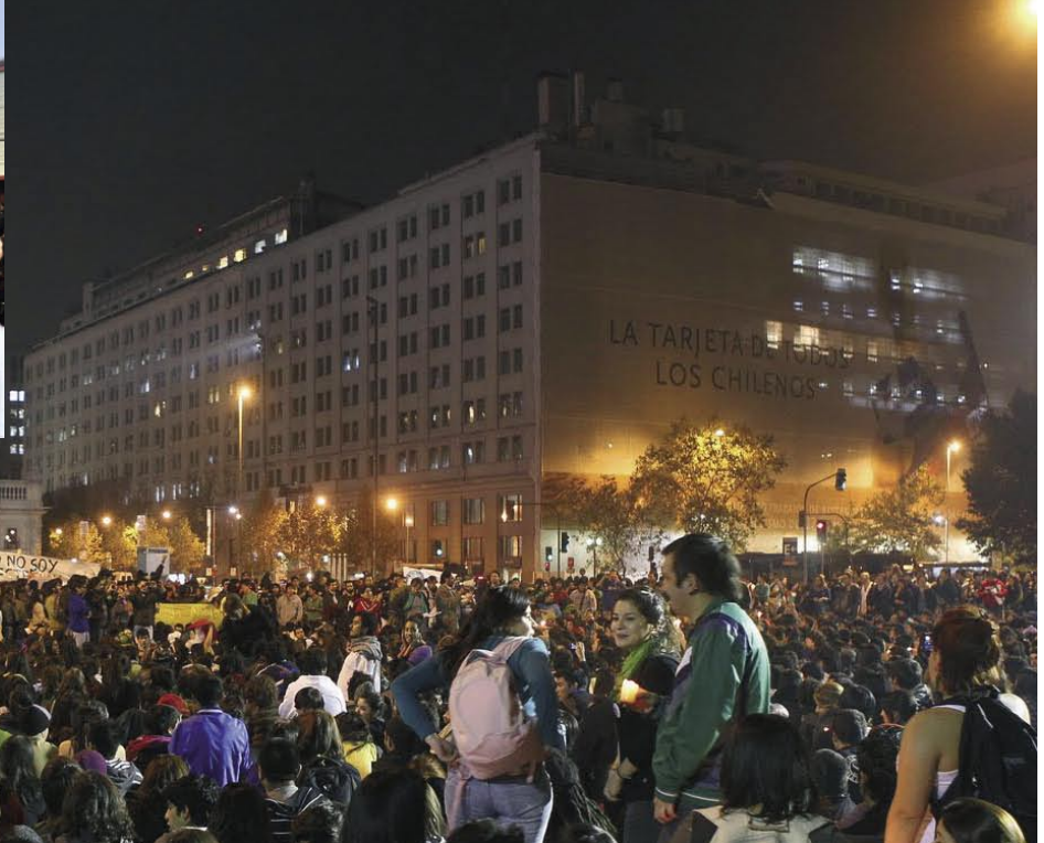
Der Widerstand gegen große Wasserkraftprojekte in Patagonien löste in Chile eine ganze Welle sozialer Proteste aus.